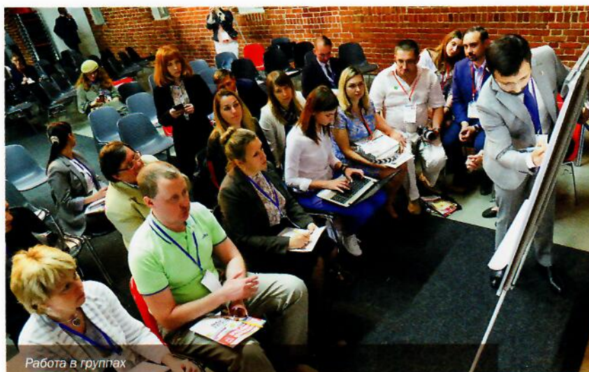
Работа в группах